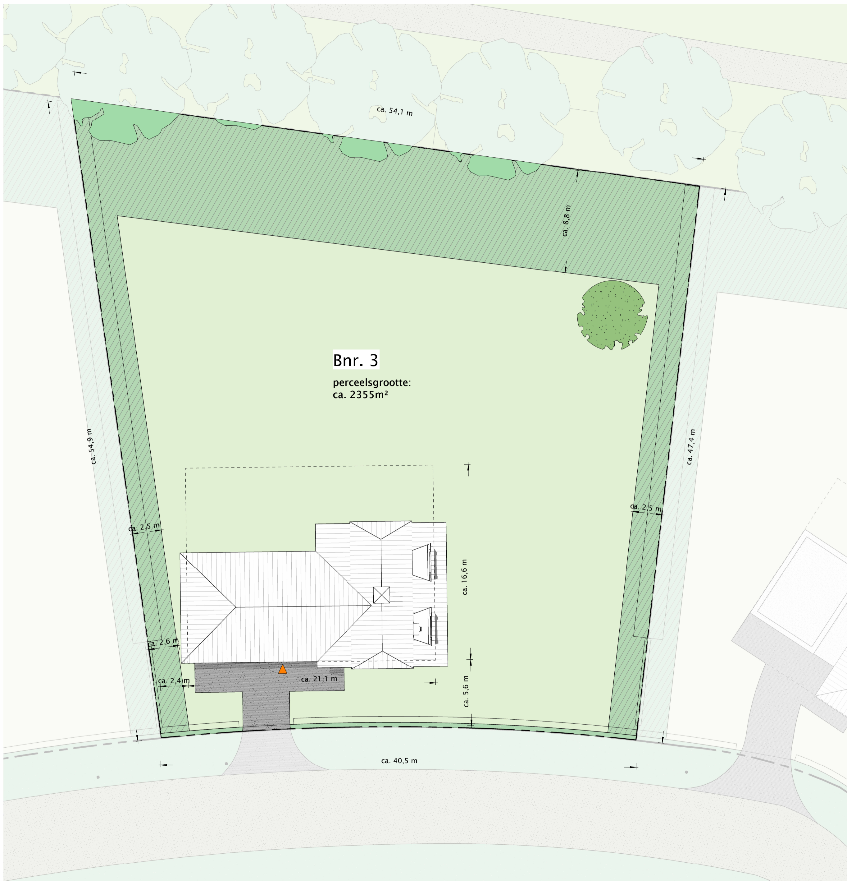
kavel bouwnummer 3 1 : 200